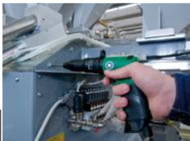
DL-Schrauber mit vorgeschobener Pistolengriff