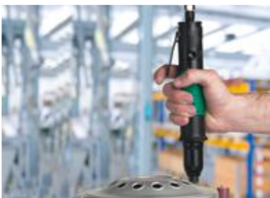
DL-Schrauber mit geradem Griff