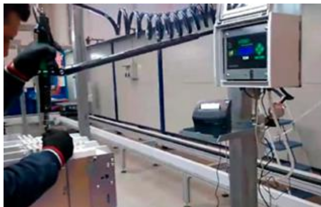
Prozess unter Kontrolle und Ausdruck der Schraubergebnisse