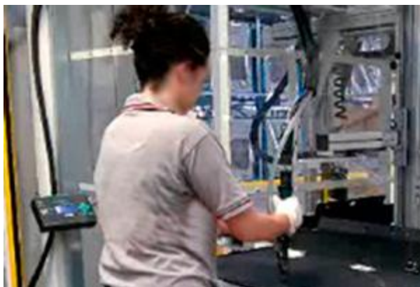
Konfiguration der an das ERP-System des Unternehmens angeschlossenen TOM-Einheit